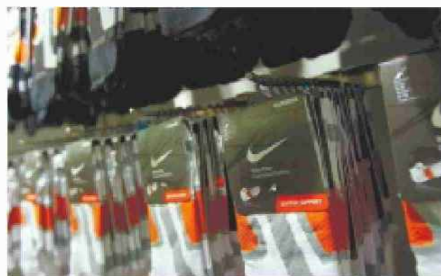
גרביים של חברת נייקי. מהלקוחות הגדולים של דלתא